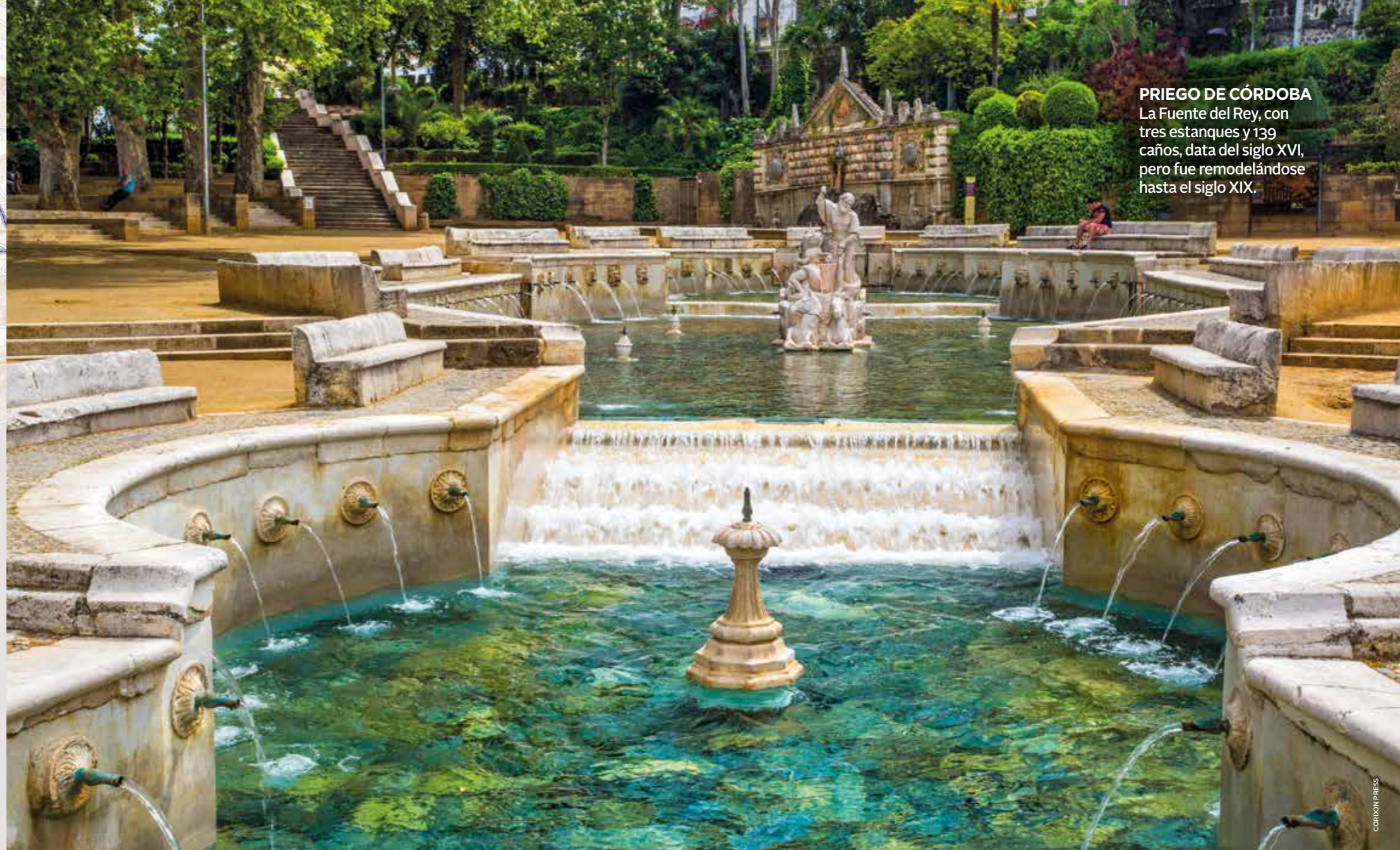
PRIEGO DE CÓRDOBA La Fuente del Rey, con tres estanques y 139 caños, data del siglo XVI, pero fue remodelándose hasta el siglo XIX.

grande de la provincia de Córdoba. Durante la década de los 40, el boticario realizó exploraciones que documentó en artículos.