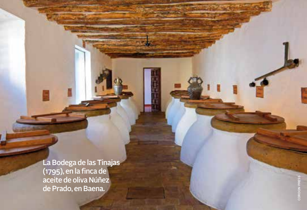
La Bodega de las Tinajas (1795), en la finca de aceite de oliva Núñez de Prado, en Baena.