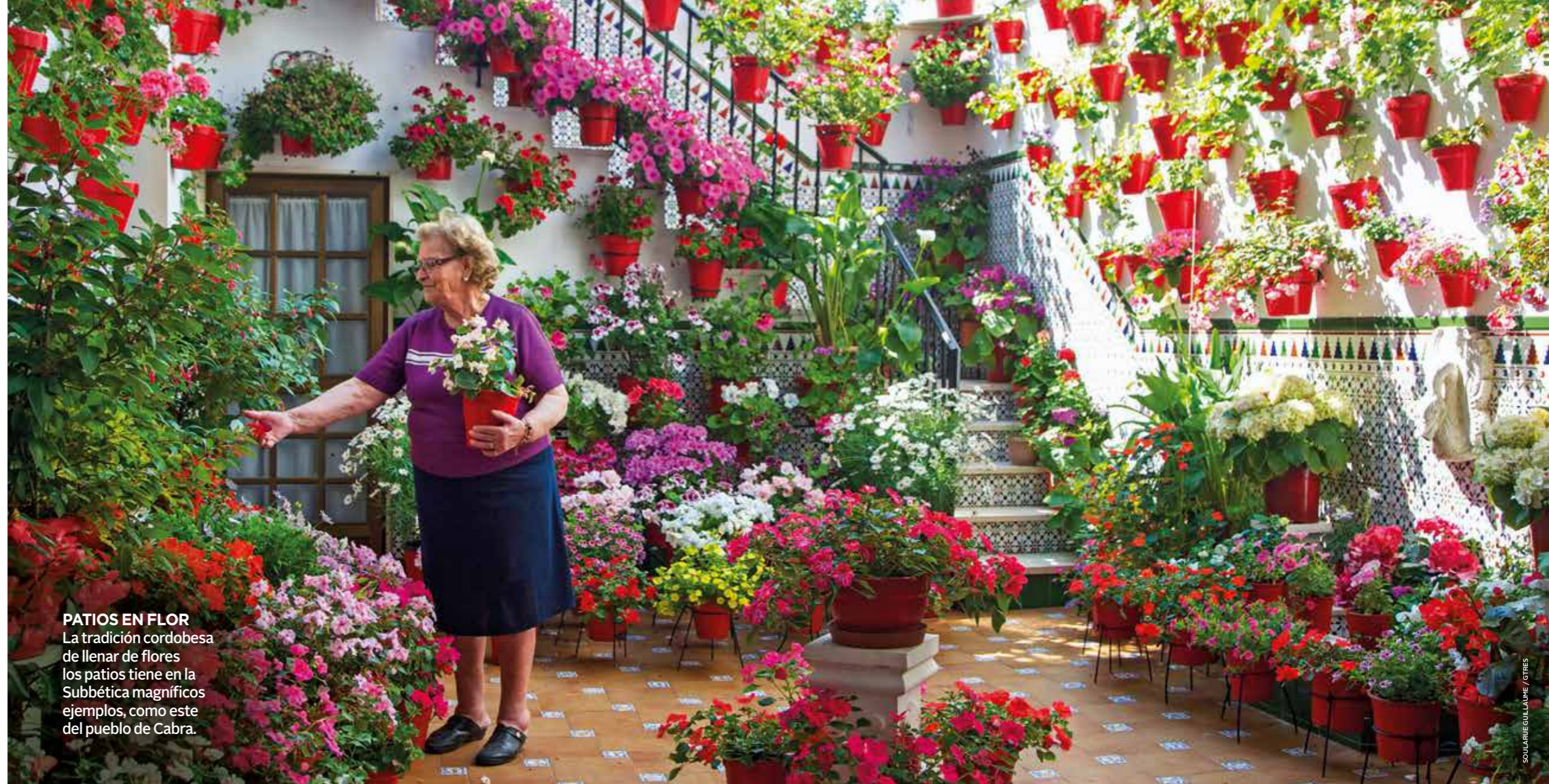
PATIOS EN FLOR La tradición cordobesa de llenar de flores los patios tiene en la Subbética magníficos ejemplos, como este del pueblo de Cabra.

la cabeza hacia el oeste, los pies al este y la cara un poco girada al sur a la espera del juicio final... O a la espera de que una pala diera con él en el siglo XXI. En realidad, diez siglos es mucha eternidad cuando la naturaleza del hombre no es divina: «Descanse en paz hasta que venga el Consolador que anuncie la paz en la puerta de la paz. Decidle: descansa en paz», eso es lo que había escrito en la lápida. La recreación de las antiguas tumbas, cuya silueta queda dibujada en oxidado acero corten en el suelo, semeja una enorme instalación artística que emociona a judíos llegados de todo el mundo.