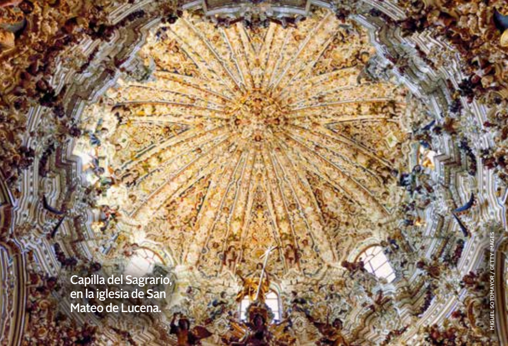
Capilla del Sagrario, en la iglesia de San Mateo de Lucena.