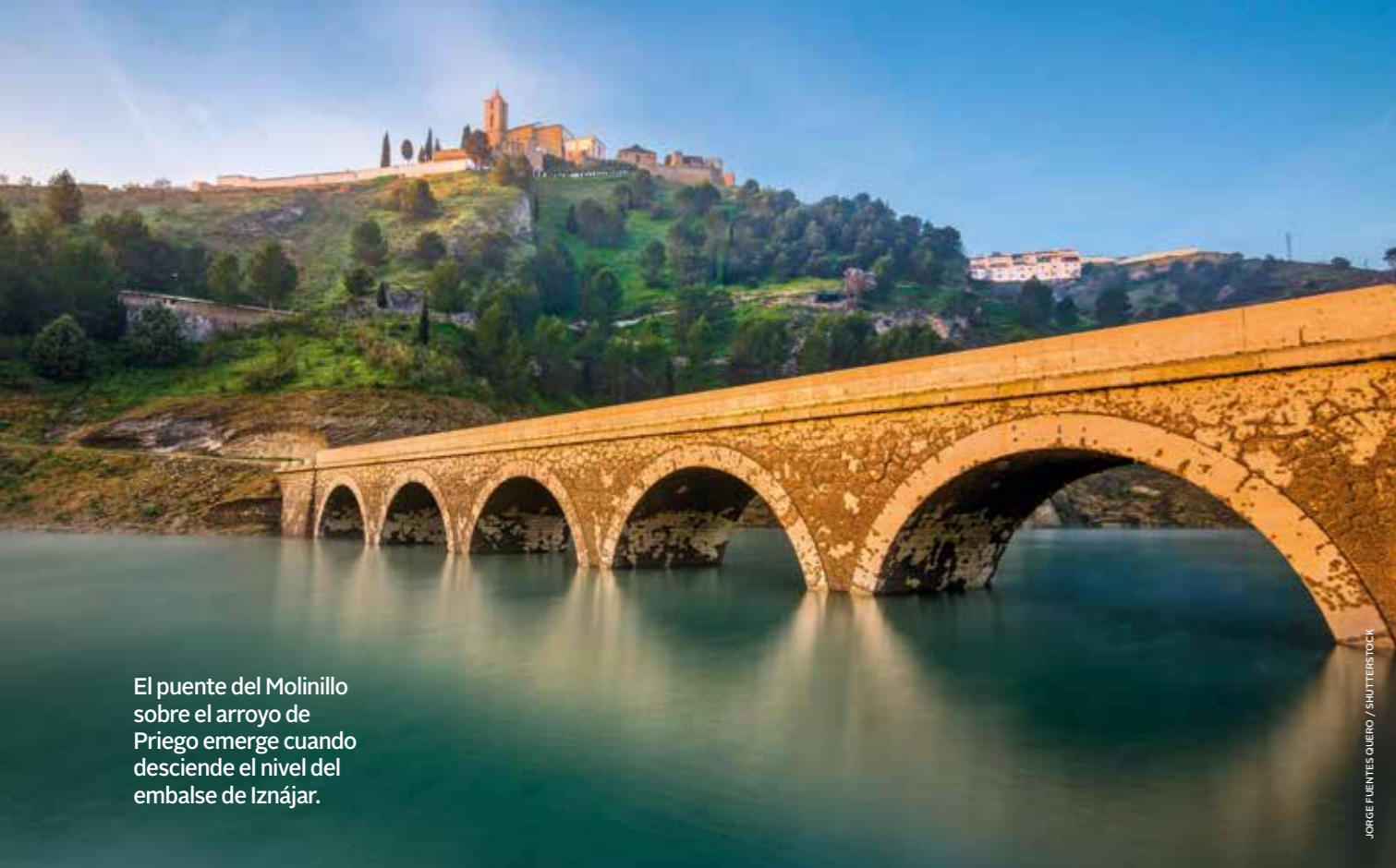
El puente del Molinillo sobre el arroyo de Priego emerge cuando desciende el nivel del embalse de Iznájar.