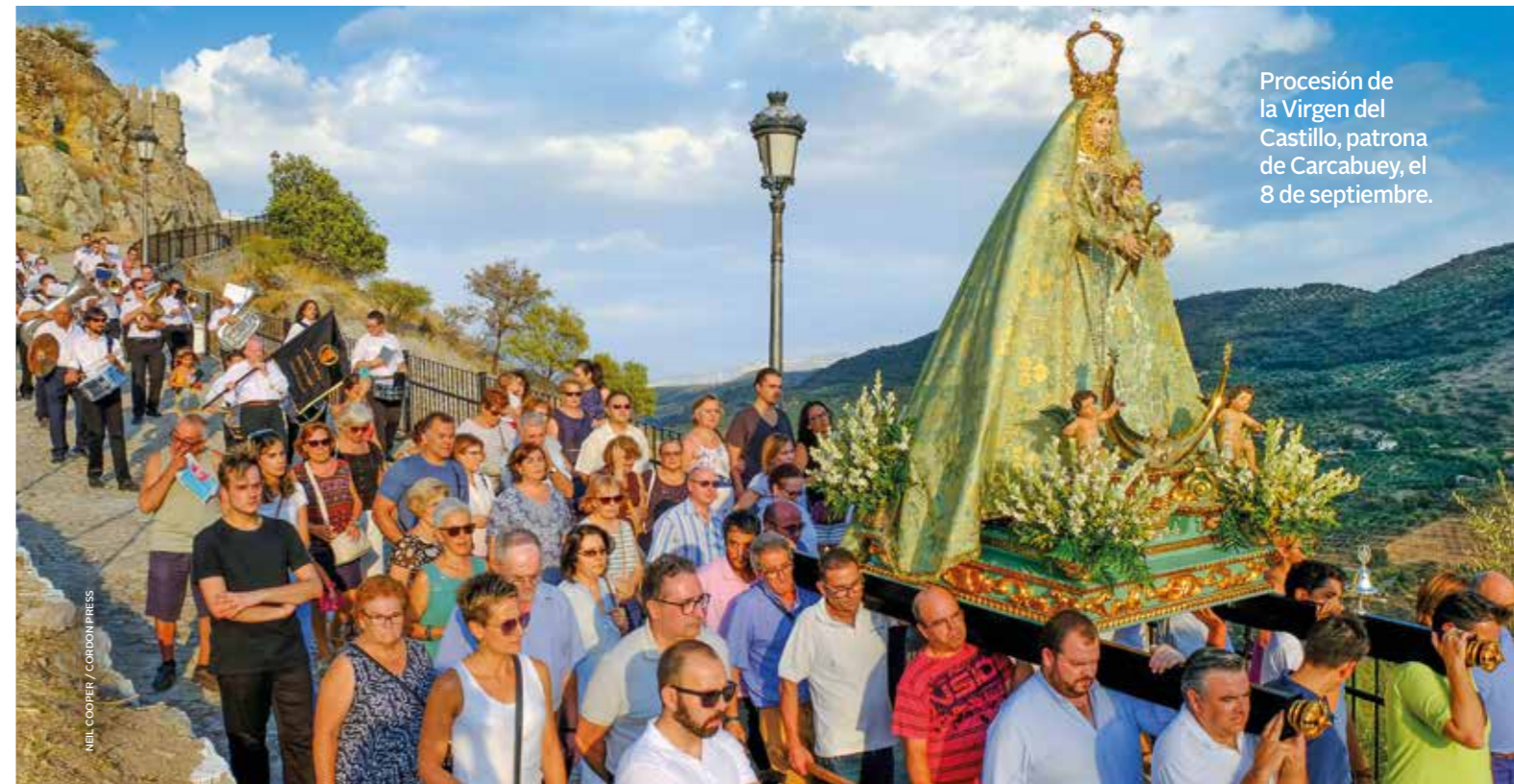
Procesión de la Virgen del Castillo, patrona de Carcabuey, el 8 de septiembre.