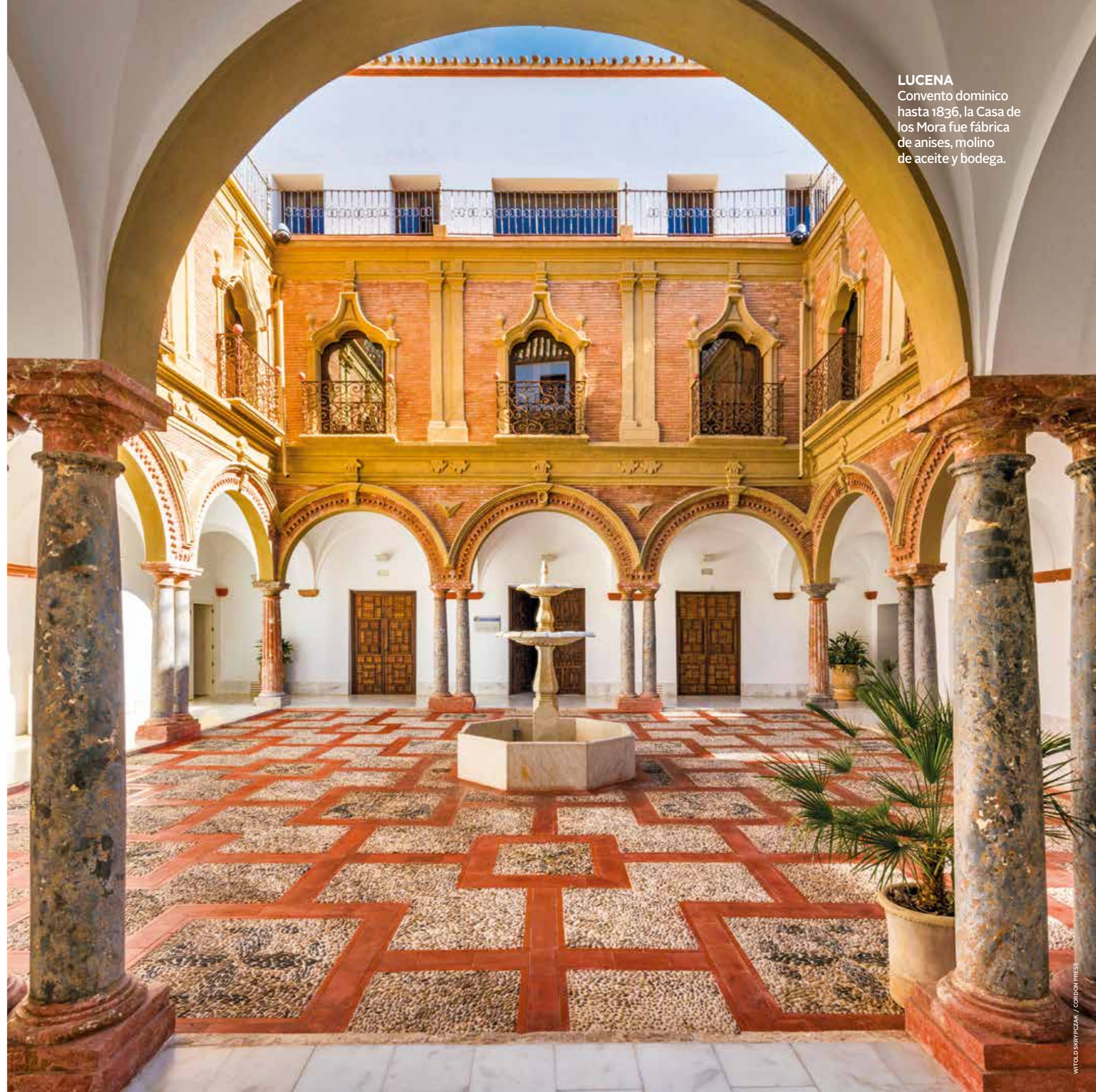
LUCENA Convento dominico hasta 1836, la Casa de los Mora fue fábrica de anises, molino de aceite y bodega.

Como si fuera un espejismo, exactamente, así debió de pestañear incrédulo, desconfiando de lo que veía, quien dio accidentalmente con los primeros restos de una tumba durante la construcción de la Ronda Sur de Lucena en 2005. La misma carretera por la que circulo es a la que se debe uno de los hallazgos arqueológicos más espectaculares de las últimas décadas en Andalucía. A lado y lado